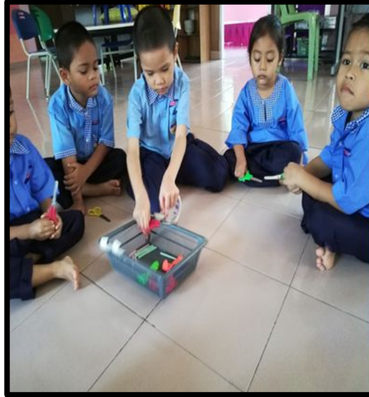
Kanak-kanak menggunting pita pelek