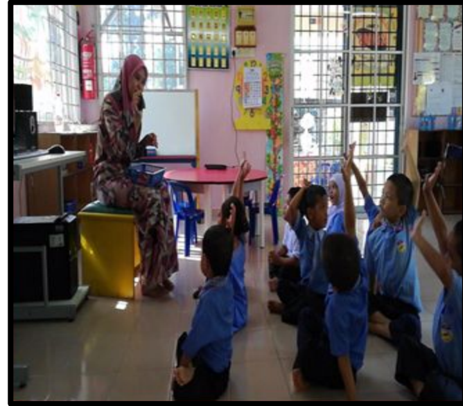
Guru bersoal jawab bersama kanak-kanak tentang belon