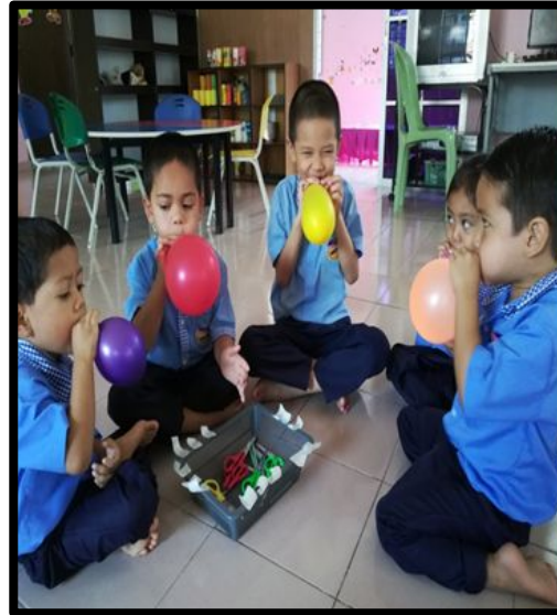
Kanak-kanak meniup belon