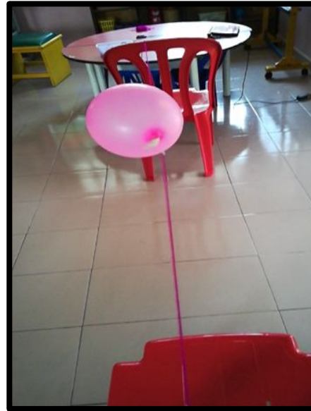
Kanak-kanak melepaskan belon melalui benang bulu kambing dan roket belon meluncur laju