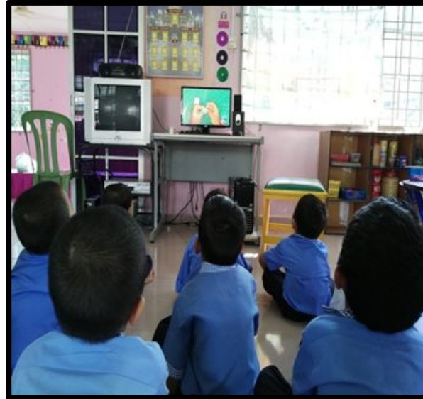
Kanak-kanak menonton video cara membuat roket belon